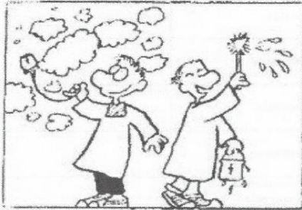
A Weil Kinder gern zündeln und mit Wasser spritzen

Für eine weitere Verstärkung des Mini-Teams würden wir uns alle sehr freuen.