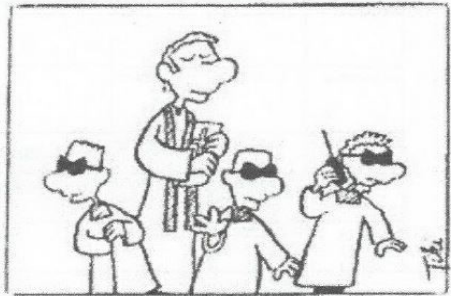
D Als Bodyguards des Priesters

In der Woche vom 9. - 14. November liegen, nach Vorschrift der Finanzkammer, die Kirchenrechnungen während der Bürozeiten im Pfarramt zur Einsicht ein.