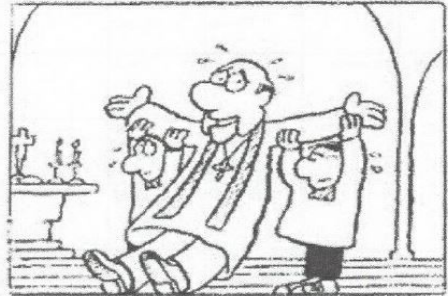
B Um den Pfarrer bei der Messe zu unterstützen